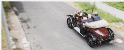
Fast ausschliesslich mindestens hundertjährige Autos waren an der Rasanz unterwegs, eine ganz besondere Erfahrung.