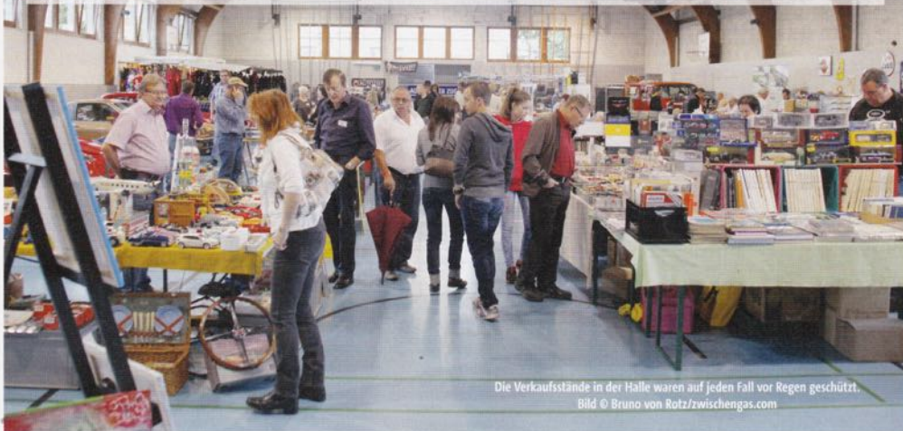
Die Verkaufsstände in der Halle waren auf jeden Fall vor Regen geschützt.